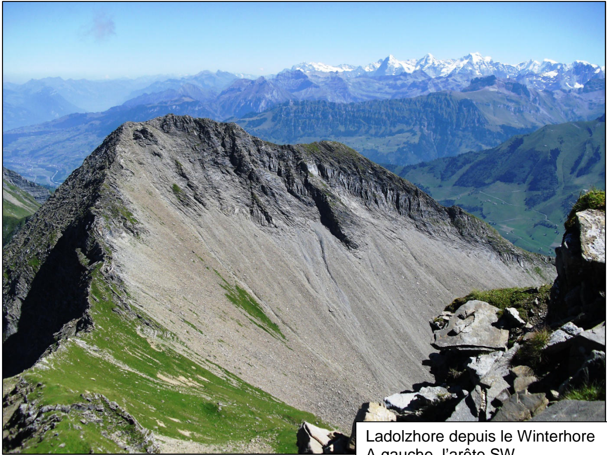
Ladolzhore depuis le Winterhore A gauche, l'arête SW A droite, l'arête SSE