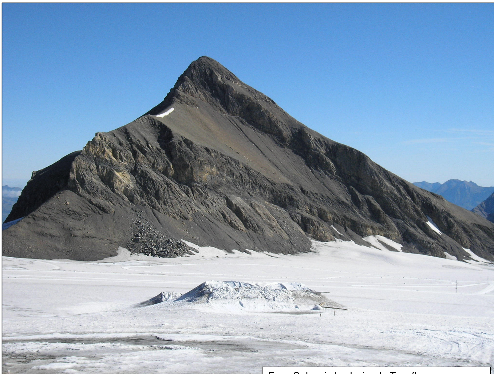
Face S depuis le glacier de Tsanfleuron