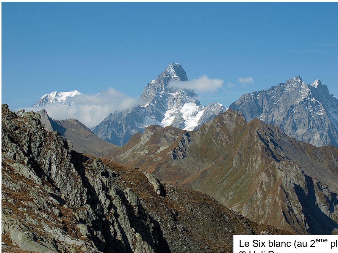
Le Six blanc (au 2 ème plan)